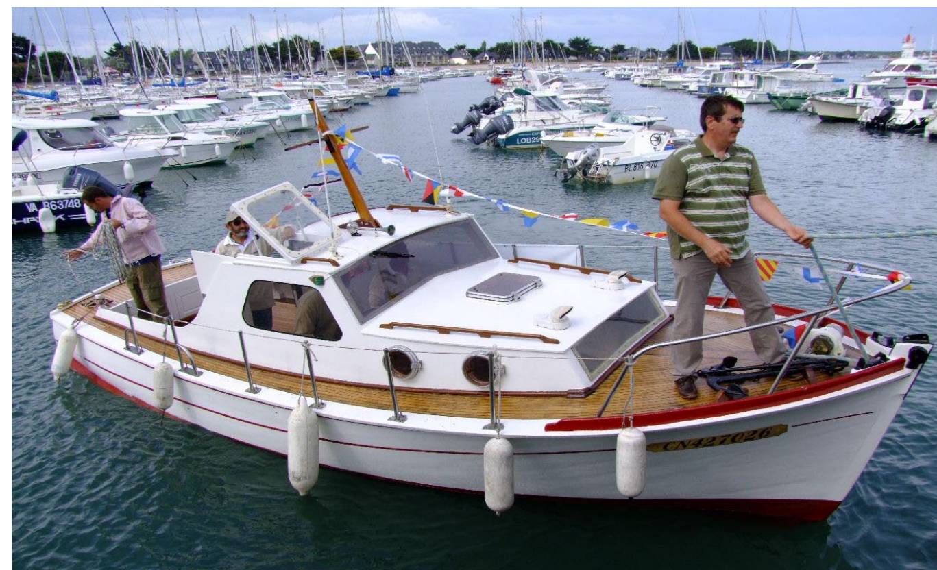
Premières manoeuvres ET ...