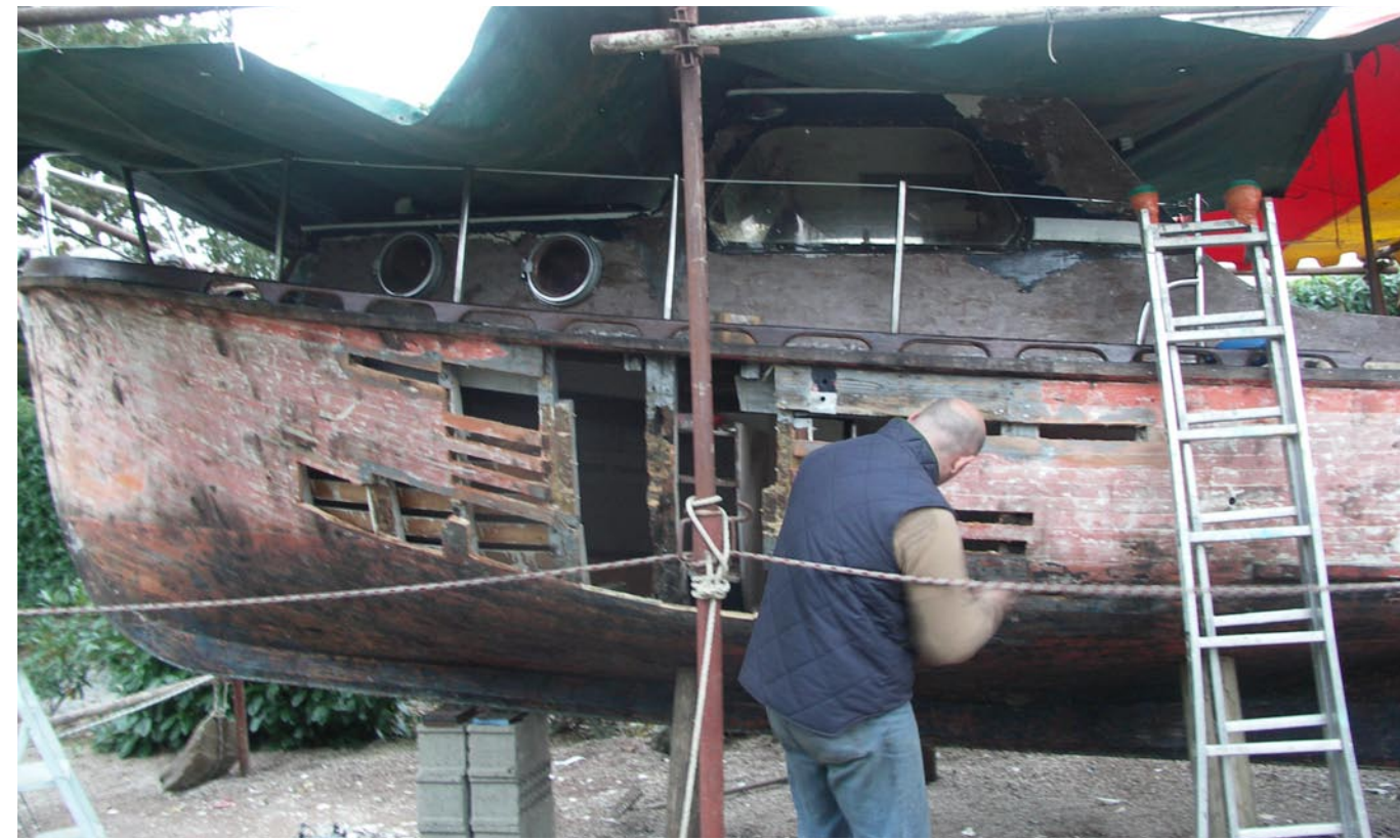
Début des travaux, Purge des bois pourris.

Le travail mené avec soin a conduit à un résultat exemplaire.