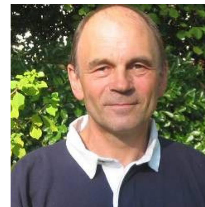
Gérard d'Aboville Président de la fondation du patrimoine maritime et fluvial

Son plus grand chantier reste la création du label Bateau d'Intérêt Patrimonial, une réussite puisque la flotte des BIP devrait s'élever cette année à près de 600 bateaux, ce qui démontre la volonté de reconnaissance par les propriétaires de la valeur culturelle de leur navire.