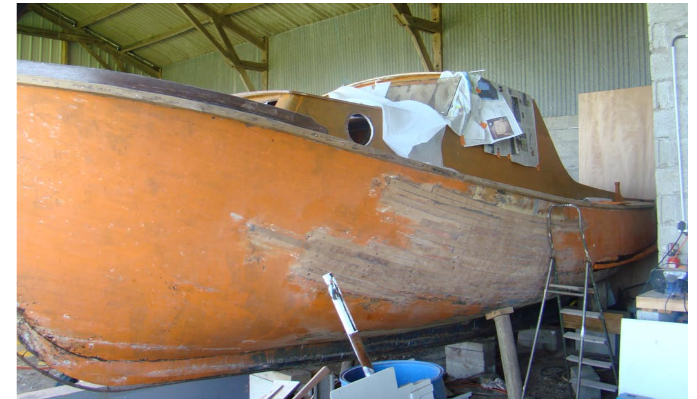
4.5 m2 de bordés changés au total + 2 membrures et 1 varangue.