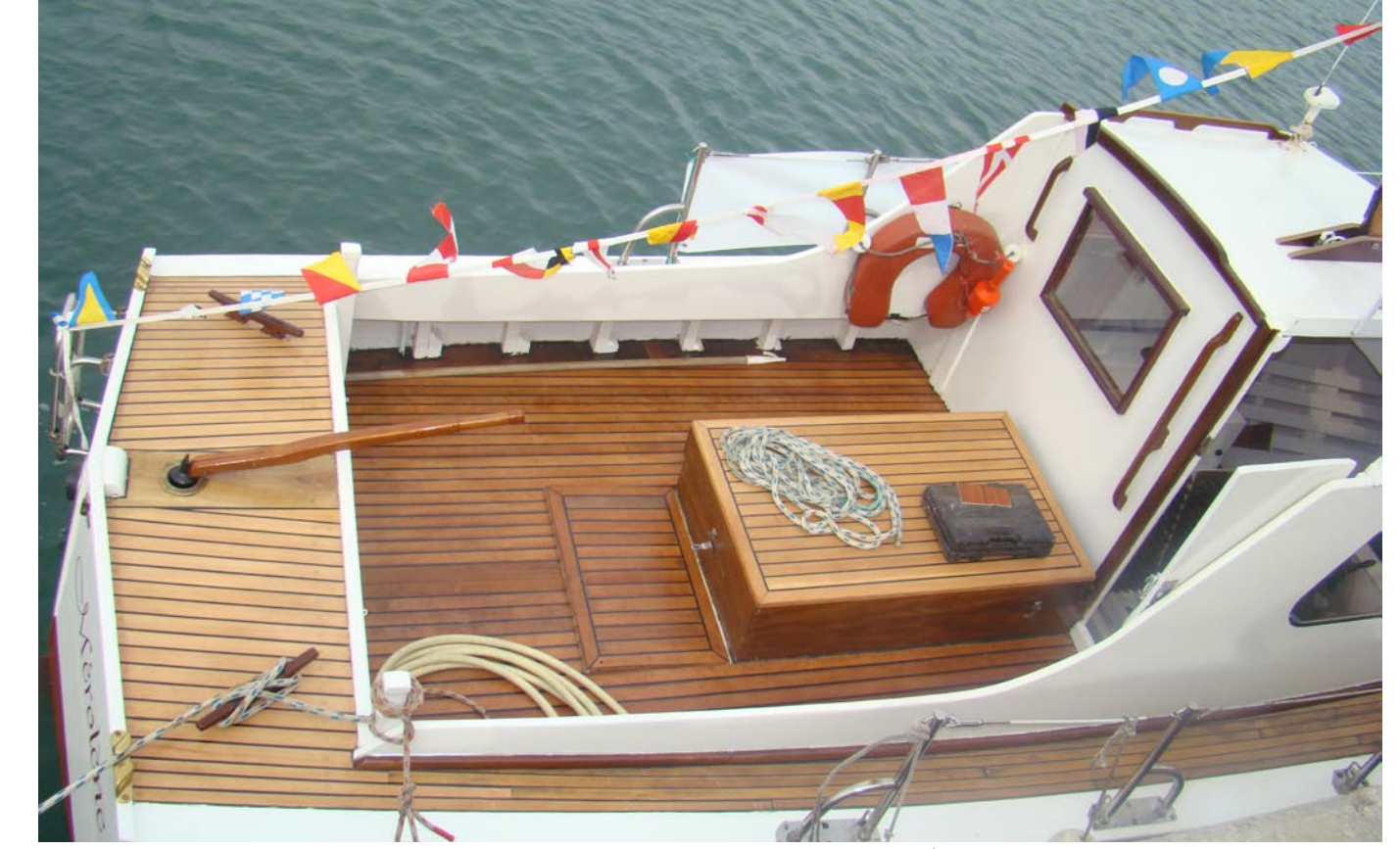
pont et tonture de coffre arrière en petites lattes de pin d'orégon et sapelli .