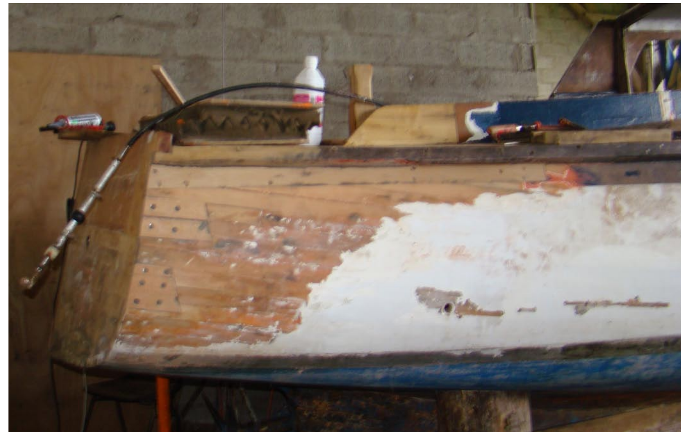
Reprise des extrémités de bordés